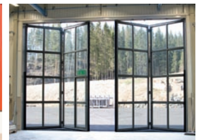
Helglasad utåtgående 4-delad vikport (energiglas). Portautomatik med låga drift och elkostnader.