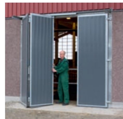
Utåtgående 3-delad vikport. Heltäckt lackerad plåt. Varmförzinkad.