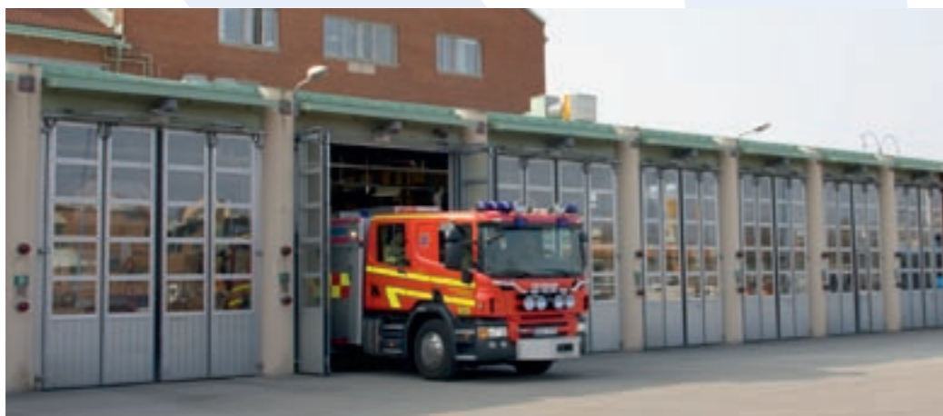
SOS Alarm, Gårda, Göteborg. Anläggning med 22 portar. 4-delad utåtgående vikport. 5 rader med energiglas. Varmförzinkad. Fjärrstyrd portautomatik med låga drift och elkostnader.