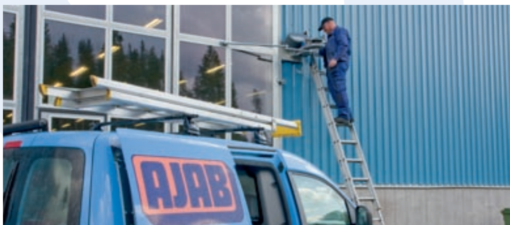
Vi erbjuder, förutom nymontage, även underhållsservice för lång och frekvent användning.

Våra vikportar går att få i en nästan oändlig mängd utföranden. Grunden är att de kan erhållas från två till åtta-delade, inåt eller utåtgående, välj handmanövrerade eller motoriserade. Vi konstruerar och bygger efter dina förutsättningar. Naturligtvis med vårt kompromisslösa val av bästa råmaterial för lång och säker driftssäkerhet. I vårt bildkollage, på nästa uppslag, visar vi en liten del av de över 30 000 portarna vi levererat genom åren.