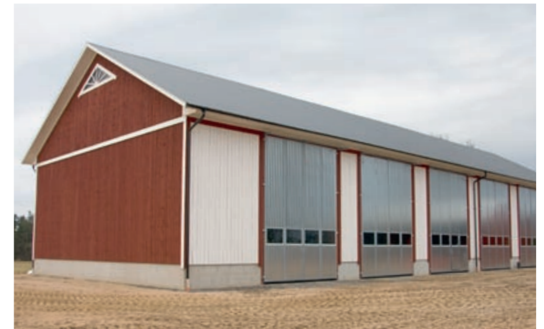
Utåtgående 4-delad vikport. Klädd med varmförzinkad plåt. 1 rad med energiglas.