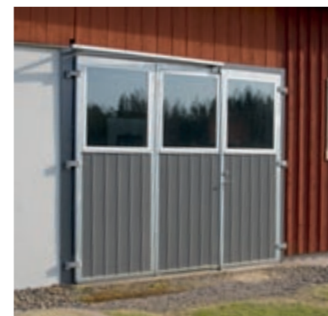
3-delad vikport varav 1 del som gångdörr.