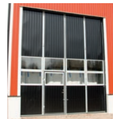
4-delad inåtgående vikport med infälld gångdörr. Klädd med lackerad plåt. 2 rader energiglas.