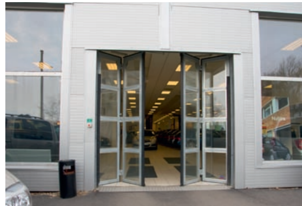
4-delad inåtgående vikport. Helglasad med energiglas. Varmförzinkad. Portautomatik med låga drift och elkostnader.

Vid eventuellt mindre sidoutrymme, finns möjlighet till olika speciallösningar. Kontakta AJAB för närmare upplysningar.