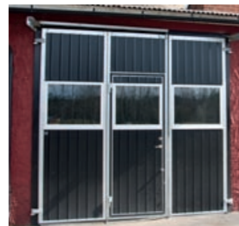
3-delad vikport med infälld gångdörr.